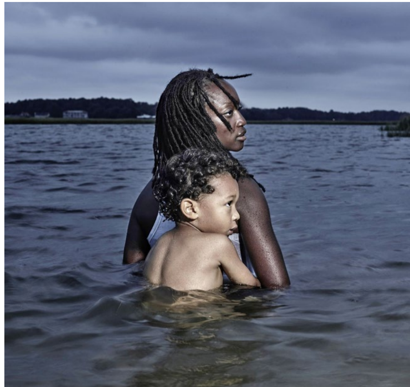
Szene aus dem Film «The Human Element».

«Filme für die Erde», 21. September, Kino Chur, www.filme fuer dieerde.org