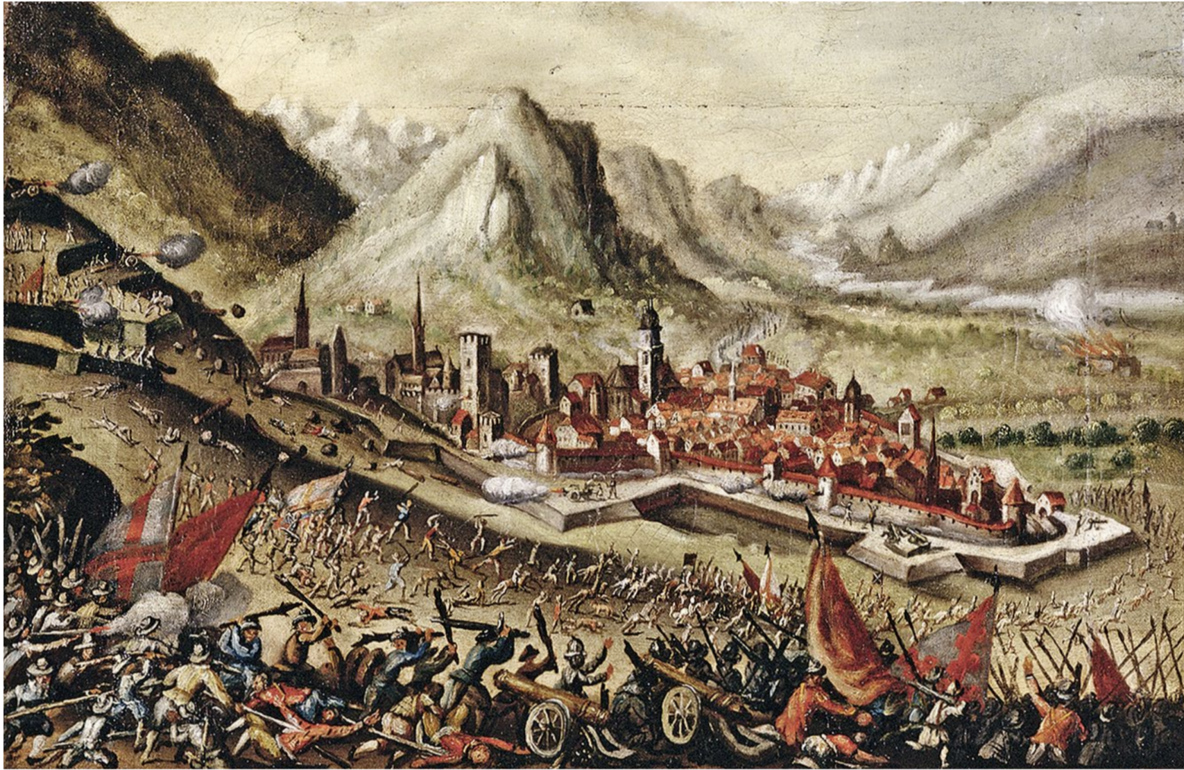
Belagerung von Chur im Dreissigjährigen Krieg: Gemälde nach einem Stich von Matthäus Merian.

Geschichte Von 1618 bis 1648 kämpften Katholiken und Protestanten um die Vorherrschaft in Europa. Die damalige Schweiz blieb fast verschont und profitierte vom Krieg auf deutschem Boden.