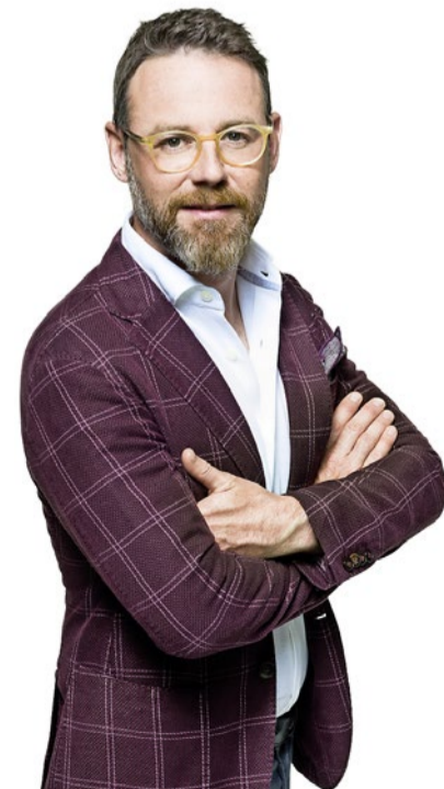
Nik Hartmann moderiert die schweizweit beliebte Sendereihe «SRF bi de Lüt».