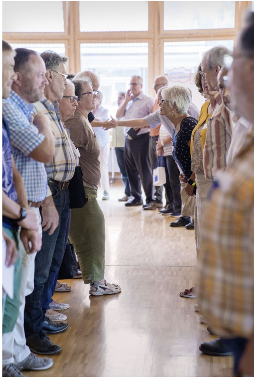
Gemeinsam in die Zukunft: die Bündner Kirchenvorstände.

sich dem gegenüber offen und wiesen darauf hin, dass die gemeinsame Leitung in vielen Bündner Gemeinden bereits Alltag sei. Einige nutzen den Workshop jedoch auch, um mal offen kleine oder grössere Missstände anzusprechen. An einem Flipchart wurden Wünsche