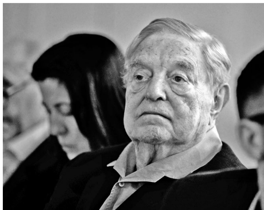
George Soros setzt Milliarden für eine offene Gesellschaft ein.