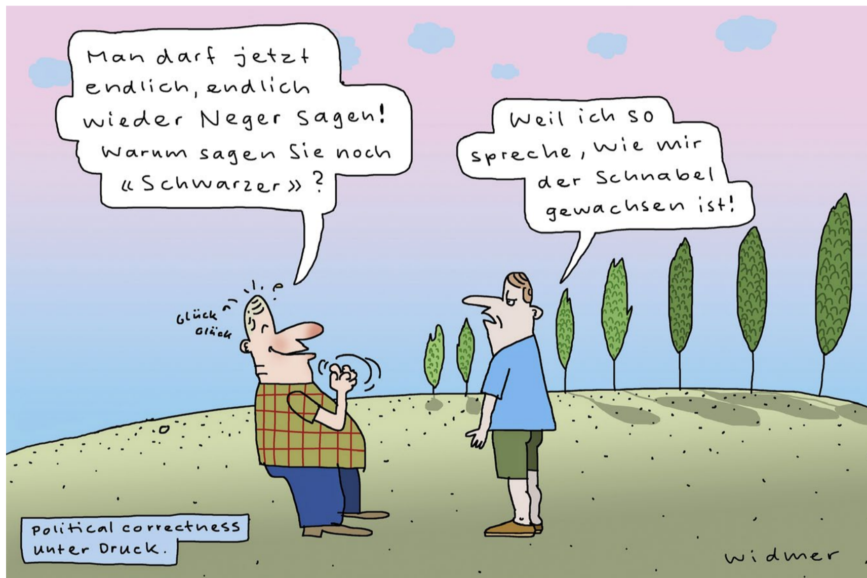
Cartoon: Ruedi Widmer

Debatte Die politische Korrektheit ist offenbar besiegt. In der Weltpolitik werden die Ellbogen ausgefahren. Gedanken über Paulus und die Alternative für Deutschland, Putin und Pippi Langstrumpf.